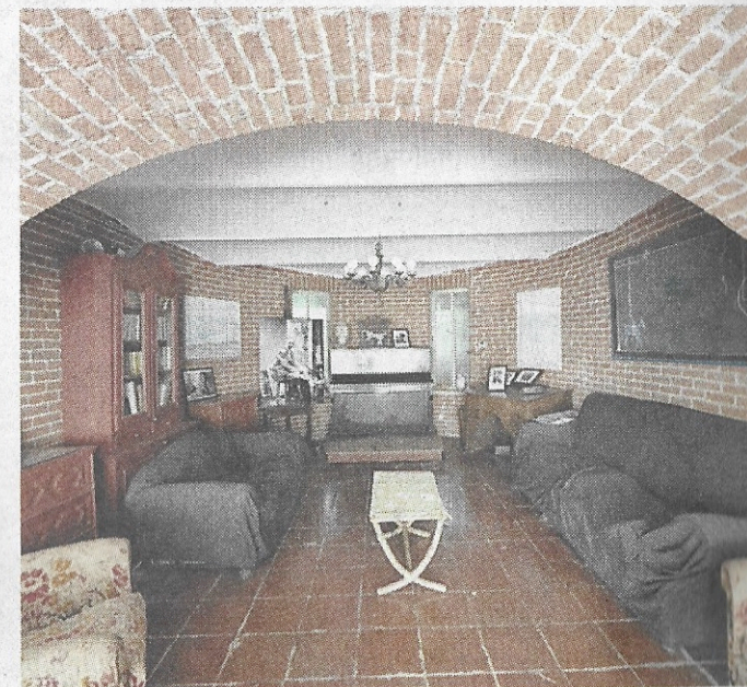
L'interno della Casa Casorati