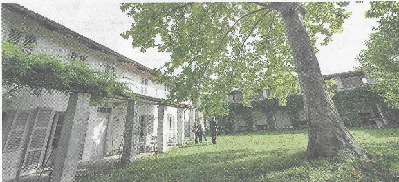
La Casa-Museo di Casorati in via Maestra, a Pavarolo, acquistata nel 1930