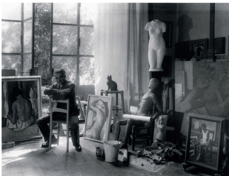
Felice Casorati in studio