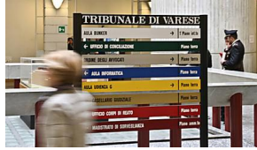
Animatore varesino accusato di stupro: slitta l... Il Tribunale di Varese si esprimerà sulla vicenda del giovane animato...