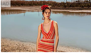
I colori di tendenza da indossare quest'estate Rosa azalea, azzurro cielo: l'estate 2022 è un viaggio nel colore. Sco... TWINSET