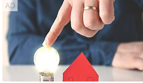
Approvato il Decreto legge aiuti: sono in arrivo 14... Immobiliare.it