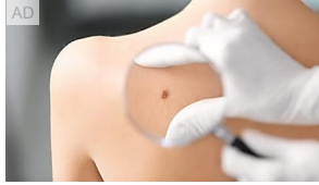
Oltre la pelle: la prevenzione al centro. Scopri di più sul... Alleatiperlasalute.it