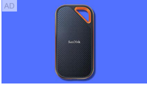
I migliori hard disk esterni: caratteristiche e prezzi wired.it - gadget