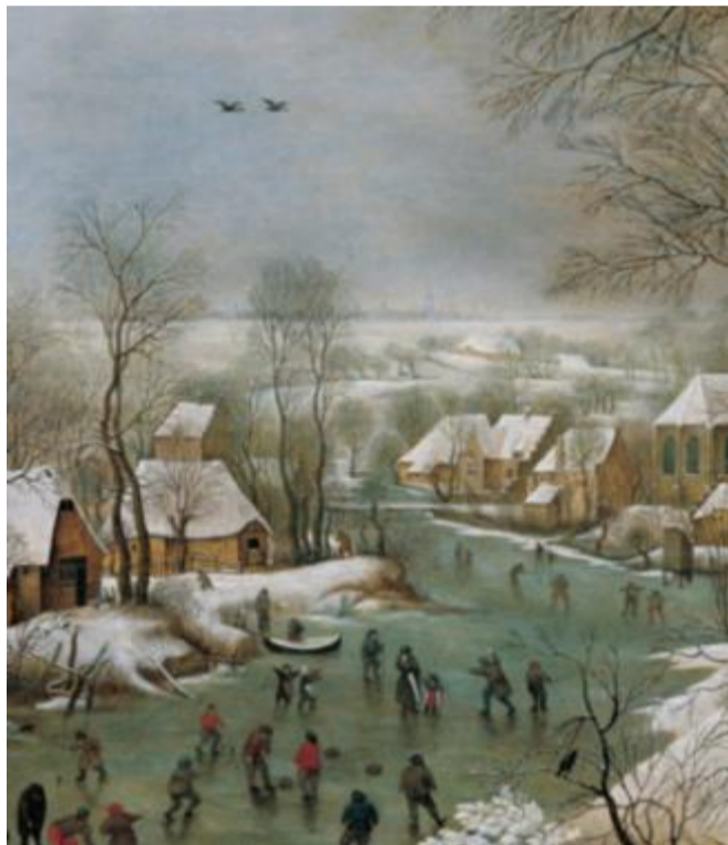
Il paesaggio invernale di Pieter Brueghel il Vecchio

Il percorso è una narrazione coinvolgente e fluida attraverso tutti i temi affrontati dai Brueghel: dalla questione religiosa, nella quale si evidenzia il timore del giudizio morale (Giudizio finale e La temperanza di Pieter Brueghel il Vecchio), alla rivoluzione nel concetto di natura, che diventa protagonista del quadro e non più semplice sfondo (di Jan Brueghel il Vecchio «San Girolamo nel deserto»), fino alla straordinaria luce dell'inverno che ha reso iconici i paesaggi fiamminghi dei Brueghel (sono famosi i quadri con i pattinatori, ad esempio).