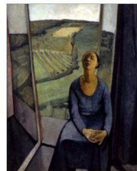
Daphne. Felice Casorati