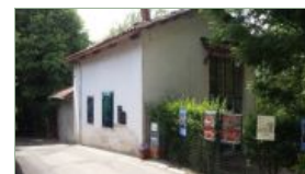
Casa-studio di Casorati a Pavarolo

Nel sempre più complesso rapporto tra uomini, paesaggio, natura e territorio, possiamo dire, facendo un rapido riassunto, che sino ad oggi il Parco del Po e Collina Torinese ha ritenuto importante e ha stimolato la questione dell'interdipendenza creativa tra natura e cultura di questo comprensorio avvalendosi di competenze esterne specifiche e ospitando in modalità sostenibile progettazioni curatoriali ad hoc. Tutto ciò impegnandosi a far dialogare le istanze naturalistico-ambientali-paesaggistiche con i linguaggi creativi della contemporaneità e affidando anche all'arte il compito di trasmettere meglio e di più i valori della natura. Lo fa sin dal 2005 con la mostra "Immagina il Po" e successive installazioni, produzioni e incontri in situ di artisti come Piero Gilardi, Tea Taramino, Fratelli De Serio, Lorenzo Dotti, Andrea Caretto, Raffaella Spagna, Enzo Bersezio, Diego Maria Gugliermetto, Karina Chechik, Raquel Nollman, Alessandro De Grandi, Stefano Doni, Roberto Grano, Carlo Lenti, Claudio Molinaro, Ilario Benedetto, Gerry Di Fonzo, Andrea Caliendo, Mauro Raffini, Michele D'Ottavio, Dario Lanzardo, Laura Frus, Margherita Caliendo, Jessica Quadrelli, Alessia Cirelli, Fulvio Chiara, Valerio Signetto, Torino Youth Jazz Orchestra, Sara Terzano, Roberto Mattea, Bati Bartolio, Walter Maticena, Gruppo Alchimea, Matteo Scovazzo, Bruno Di Menna, Pino Russo, Orchestra