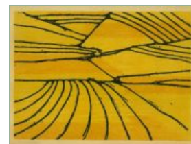
Campi. Felice Casorati